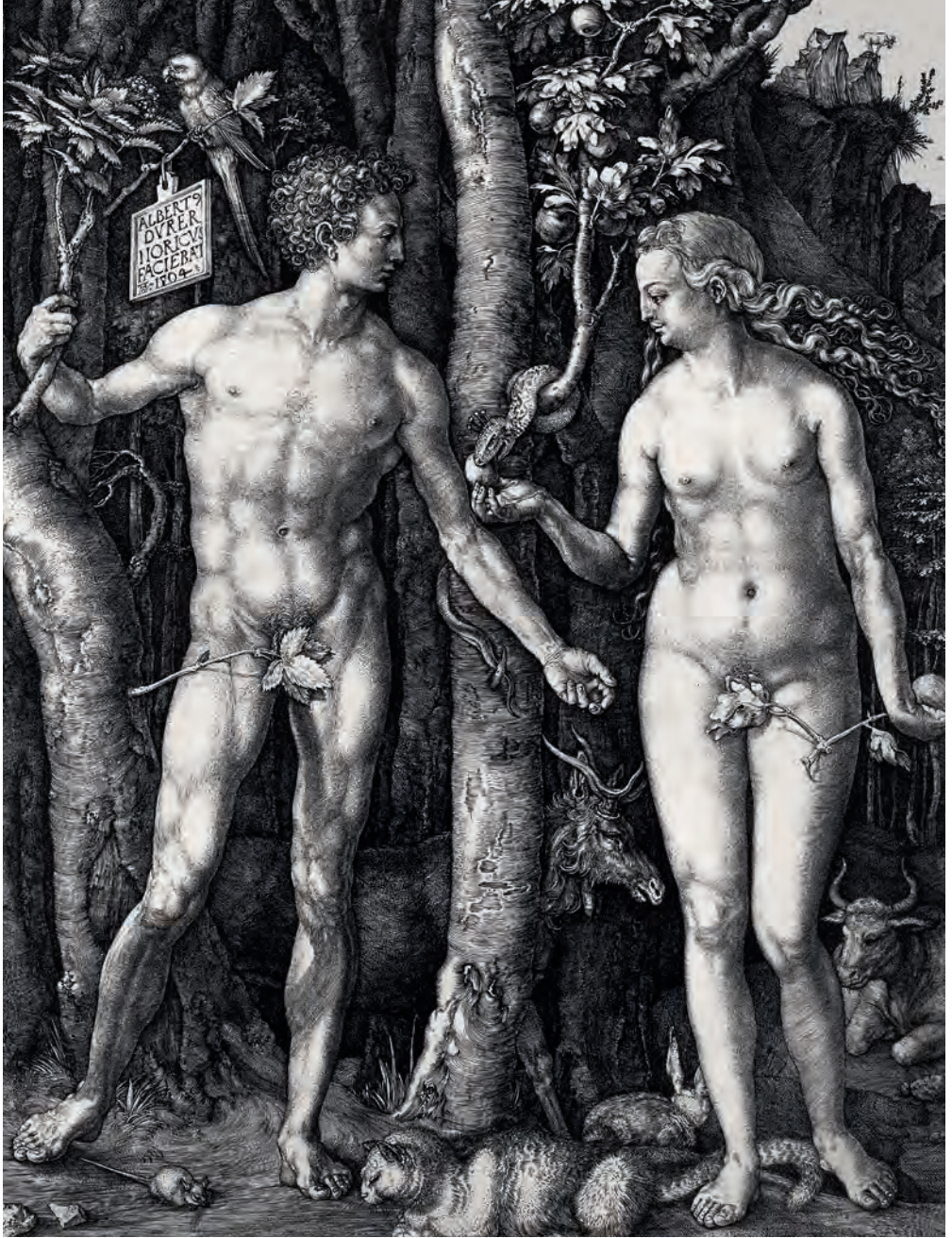
Б. Коюшенная,1 / +7 (812) 312-28-56 / artoffoto.com